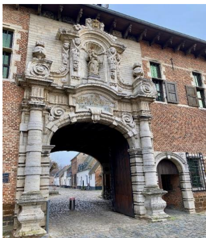
Toegangspoort Begijnhof Diest

Ieder jaar organiseert de reiscommissie in het najaar een grote excursie, dit jaar met als bestemming Diest en Hasselt. De excursie was een groot succes!