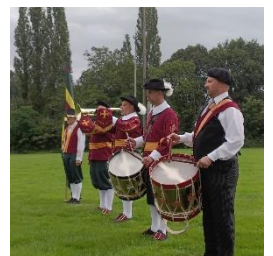
Brabantse Heemdagen 2023 Oirschot

Om dit blad te lezen, klik op: De Koerier 101