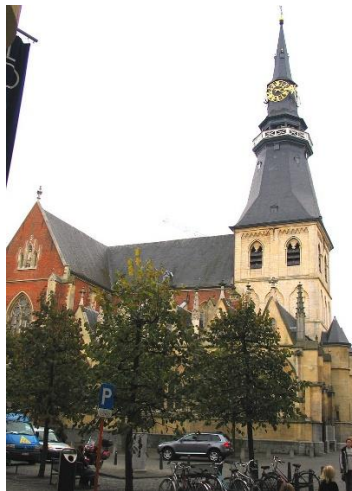
Kathedraal in Hasselt

De Reiscommissie heeft dit keer haar oog laten vallen op het charmante Nassau stadje Diest, in België waar op het gebied van historie veel te zien is. Het bezoek wordt gecombineerd met een uitstapje naar Hasselt waar eveneens veel moois te bewonderen is.