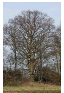
Beuk in tuin Oud Bijsterveld