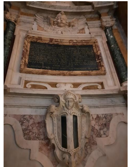
Grafmonument Christiaan van der Ameijden

De lezing vindt plaats op dinsdagavond 20 februari 2024 in de zaal van Restaurant De Beurs, St. Odulphusstraat 7, Oirschot en start om 20.00 uur. Voor leden van de heemkundekring is de lezing gratis. Ook andere bezoekers zijn van harte welkom tegen een vergoeding van € 5.-.