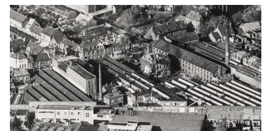
Janssens de Horion Koestraat Tilburg 1953