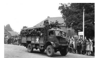
Foto Bevrijding sept 1944