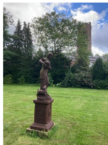
Luisteren naar Carillonconcert in Pastorietuin