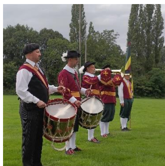
Gildegroet op terrein St Jorisingilde

Gelukkig waren de weergoden ons gunstig gezind en kon op zaterdag 5 augustus de fietstocht starten naar het groene buitengebied van Oirschot. Niet voor niets hadden de heemdagen het thema 'Heerlijkheid in het groen'. Tijdens de tocht maakte men o.a. kennis met landgoed Bijstervelt, de Antoniuskapel en het kruis van Castione. En bij de lunch op het terrein van het St Joris gilde werden de gasten verrast met een gildegroet en een spectaculair staaltje vendelzwaaien.