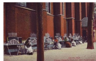
Kaarsenverkoopsters in Kevelaer