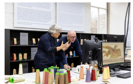
Gordijnen voor Paleis Het Loo

Tenslotte kan tot sluitingstijd nog een 'afzakkertje' genomen worden in het museumcafé.