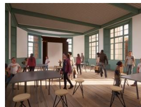
Impressie nieuw erfgoedcentrum 's-Hertogenbosch