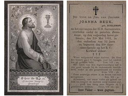
Bidprentje uit 1893