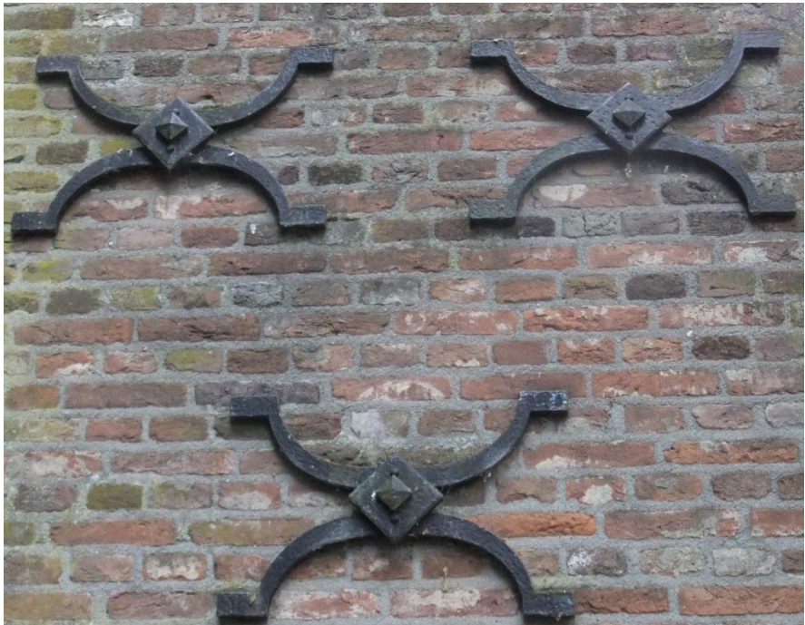
Wapen 3 molenijzers van Peelland