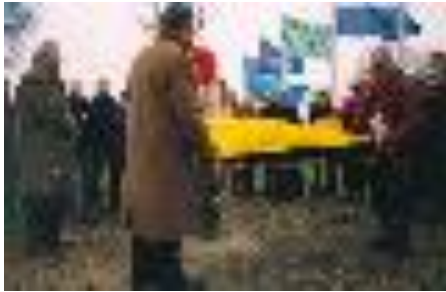
Onthulling van de grenspaal

bepaald. Toevallig was een andere instantie, het Waterschap de Dommel, in dat gebied ook met een project - het