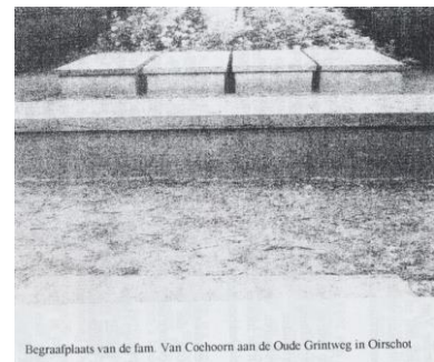
Begraafplaats van de fam. Van Coehoorn aan de Oude Grintweg in Oirschot