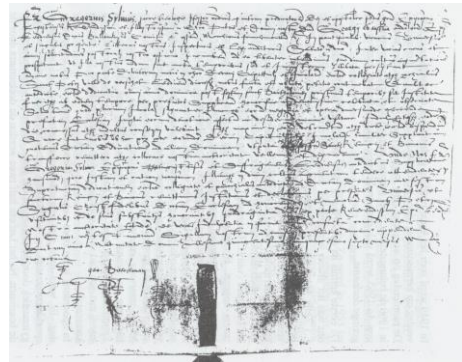
Copie van de akte van 8 mei 1556, waarin verlog wordt verleend om de kermis te verzetten naar de laatste zondag van september.

Sinds 1556 viert Oirschot zijn kerkmis op de laatste zondag in september. Daarvoor vierde men die hier op zondag na het feest van de H. Bartholomeus (24 augustus). Praktisch kwam het erop neer, dat de viering samenviel met de oogsttijd. Om die reden richtte het kapittel een verzoek aan de bisschop van Luik, die op 8 mei 1556 toestemming verleende om de kerkmis voortaan te vieren op de laatste zondag van september.