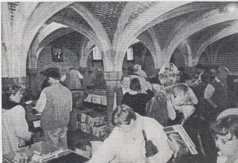
Enkele foto-impressies van de geslaagde boekenbeurs.