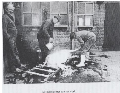
De huisslachter aan het werk.

Helemaal erg werd het als 's anderdaagssmorgens de koeketel of fornuisketel vol kokend water klaar was en de slachters met hun tas vol gevaarlijk uitzierende snij- kap- steek- en trekwapens de hoek van het huis om kwamen gereden. Dan werd het slachtoffer uit zijn kooi gehaald om door onze vader met hulp van enkele bereidwillige buurjongens ter slachtbak geleid te worden. Waarschijnlijk voelde zo'n varken aan wat de bedoeling was, want het wou alle kanten op behalve die van de wachtende slachter en de bak. Dus werd er getrokken en geduwd aan het varken. En iedereen riep en lachte, behalve het varken dat in doodsnood heel de buurt bij mekaar gilde.