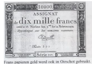
Frans papieren geld werd ook in Oirschot gebruikt.

Informatie: Resolutieboeken Streekarchief