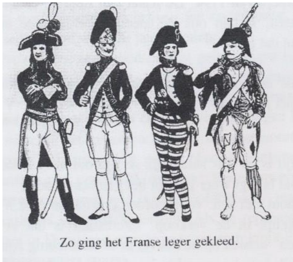
Zo ging het Franse leger gekleed.

De klokken van de kerktoren zijn klaarblijkelijk gemeentebesit, want ze moeten gecontroleerd en zonodig gerepareerd worden.