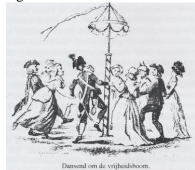
Dansend om de vrijheidsboom.

Wie herinnert zich nog de plaatjes uit de geschiedenisboekjes, waarop een zgn. Vrijheidsboom en het volk er dansend omheen? Zou Oirschot ook zo'n Vrijheidsboom op de markt gehad hebben, en heeft de Oirschotse jeugd van toen er gedanst op muziek van "een bende muzikanten" vanwege de Vrijheid, Gelijkheid en Broederschap, die de Fransen beloofden? Hebben ze misschien om praktische redenen daarvoor de ronde lindeboom gebruikt, die toentertijd op de markt stond.