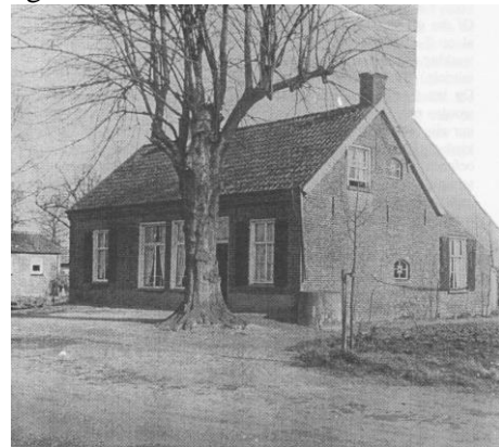
Voormalig boterfabriekje met even-oude linde.

Dit zijn zo maar enkele eisen waaraan de Stratense botermeesters moeten voldoen. Daarbij ontvangen zij het vorstelijk salaris van f 10,80 per 14 dagen.