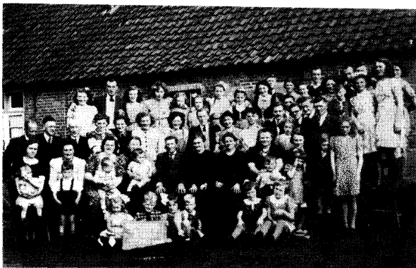
Vader en moeder Spanjers van 't Laageind omringd door familie, evacués en onderduikers. Mei 1945.

Vanaf de straat konden wij over de akkers richting Best de parachutisten als zwarte kraaien in de lucht zien hangen. Daags daarna al kwamen er Bestenaren over de akkerwegen onze richting in.