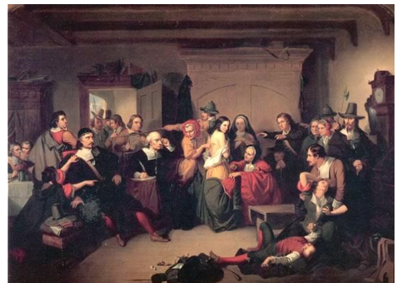
Onderzoek van een heks Thompkins H. Matteson 1853

Allereerst komt in de lezing aan de orde wat we onder een heks verstaan en welke beeldvorming er zoal is over heksen. Soms is dat beeld positief zoals dat van het wijze kruidenvrouwtje maar ook vaak negatief zoals het beeld van de oude toverkol die ziekte en verderf onder de mensen brengt. Uiteraard kan de heksenvervolging die in Europa in het verleden plaatsvond, en waar ook Nederland en Brabant bepaald niet van gevrijwaard bleven, hierbij niet onbesproken blijven.