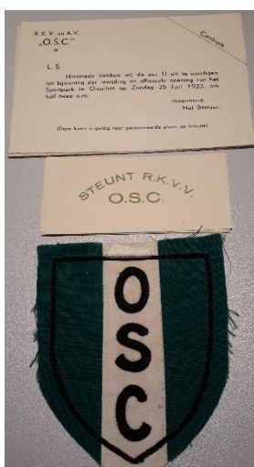
RKV en AV OSC, RKV OSC in 1933: waar staan die afkortingen voor?

Ik vraag wel veel deze keer, maar weet iemand waarvoor de afkorting OSC staat en van welke club dat is? Zie de foto. Voetbal, volleybal ....?