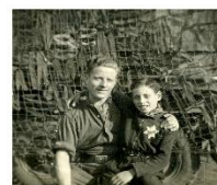
Een Britse militair omarmt een Joodse jongen 1944