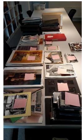
Het beeldmateriaal van Teurlinx & Meijers.

Bij deze voormalige meubelfabriek gaat het vooral om negatieven en foto's van - en catalogi met - tafels en stoelen. Wat een gevarieerde collectie had dat bedrijf! Oirschotser kan haast niet .... Maar ook beeldmateriaal van presentaties tijdens beurzen, de gebouwen (ook bouwtekeningen!), het productieproces en medewerkers.